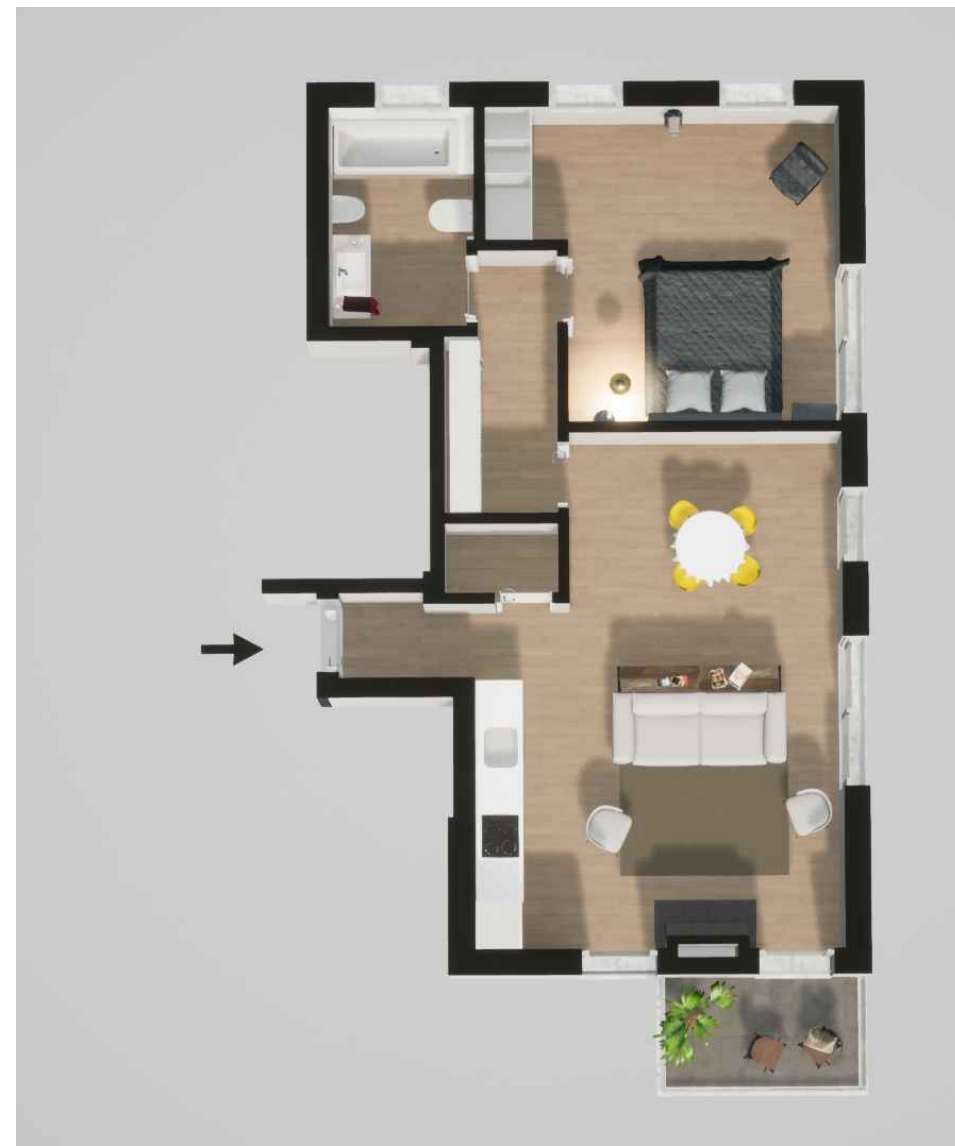
Fração B (91,80 m 2 ) Piso 0 - T1

Habitação (127,65 m 2 ) Garagem (13,50 m 2 )