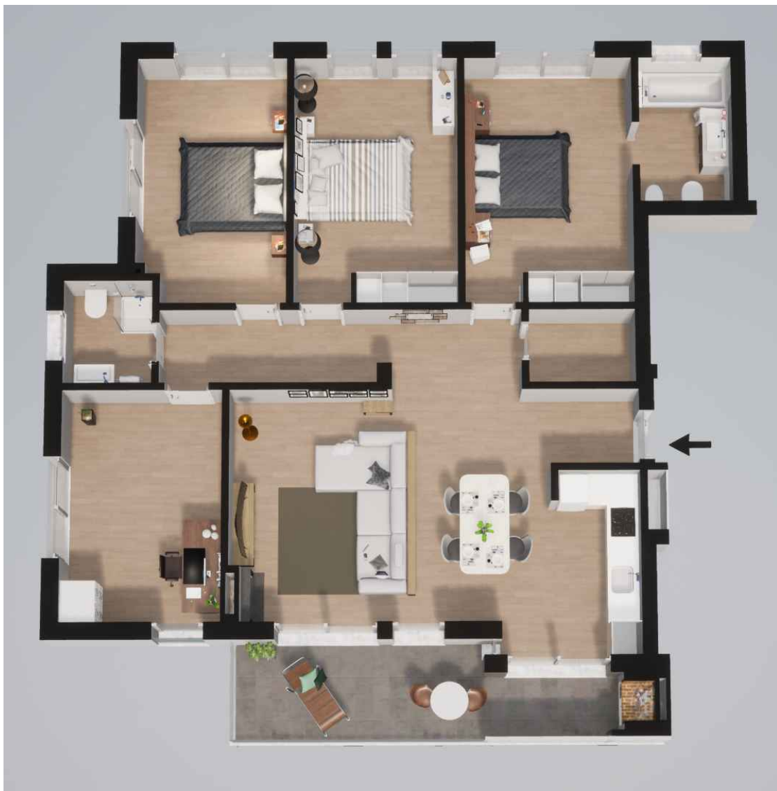
Fração C (171,75 m 2 ) Piso 1 - T4

Habitação (144,55 m 2 ) Varanda (14,70 m 2 ) - Garagem (12,50 m 2 )