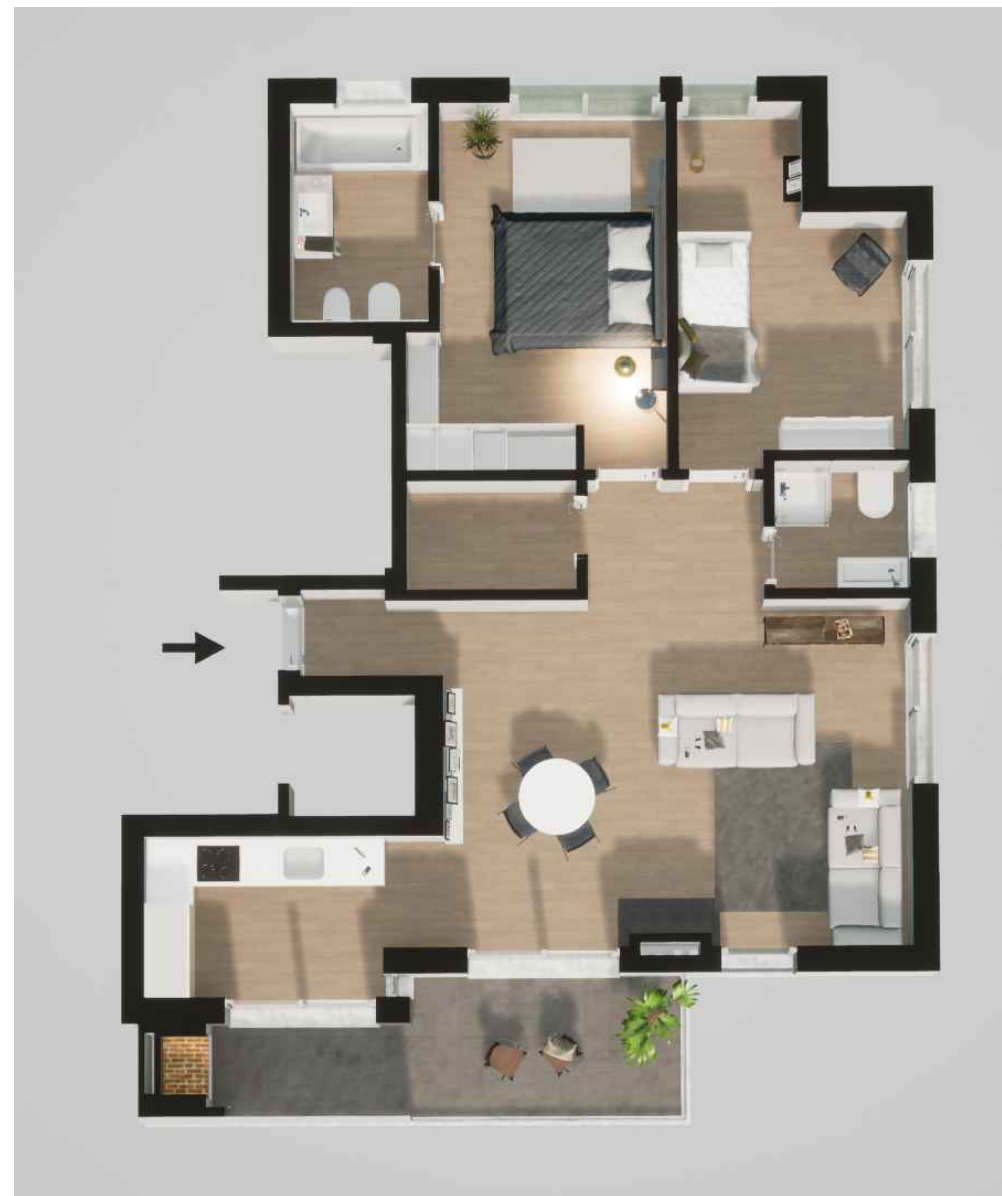
Fração D (124,70 m 2 ) Piso 1 - T2

Varanda (14,70 m 2 ) - Garagem (11,50 m 2 )