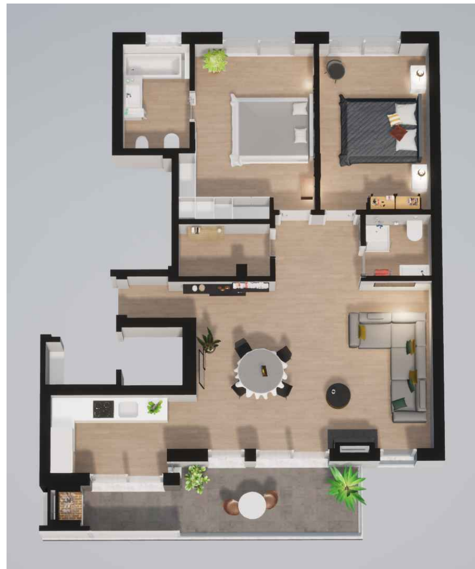
Fração D (132,75 m 2 ) Piso 1 - T2

Habitação (144,55 m 2 ) Varanda (14,70 m 2 ) - Garagem (12,50 m 2 )