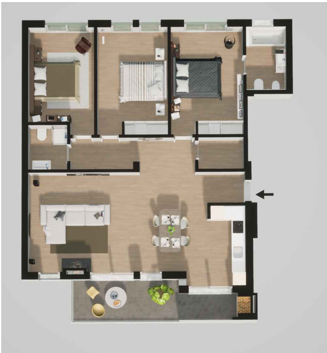
Fração C (160,45 m 2 ) Piso 1 - T3