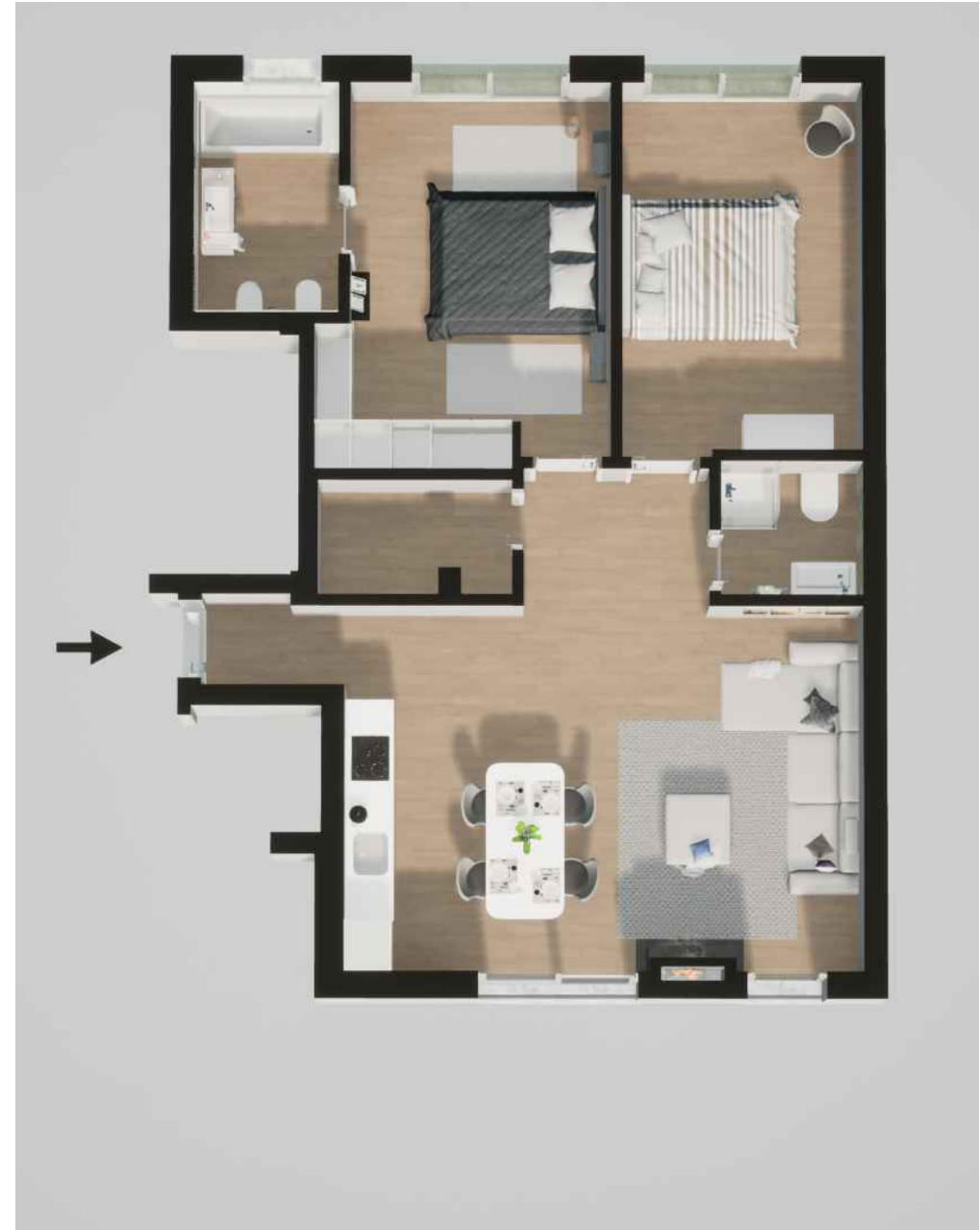
Fração B (109,65 m 2 ) Piso 0 - T2

Habitação (132,45 m 2 ) Varanda (16,90 m 2 ) - Garagem (14,75 m 2 )