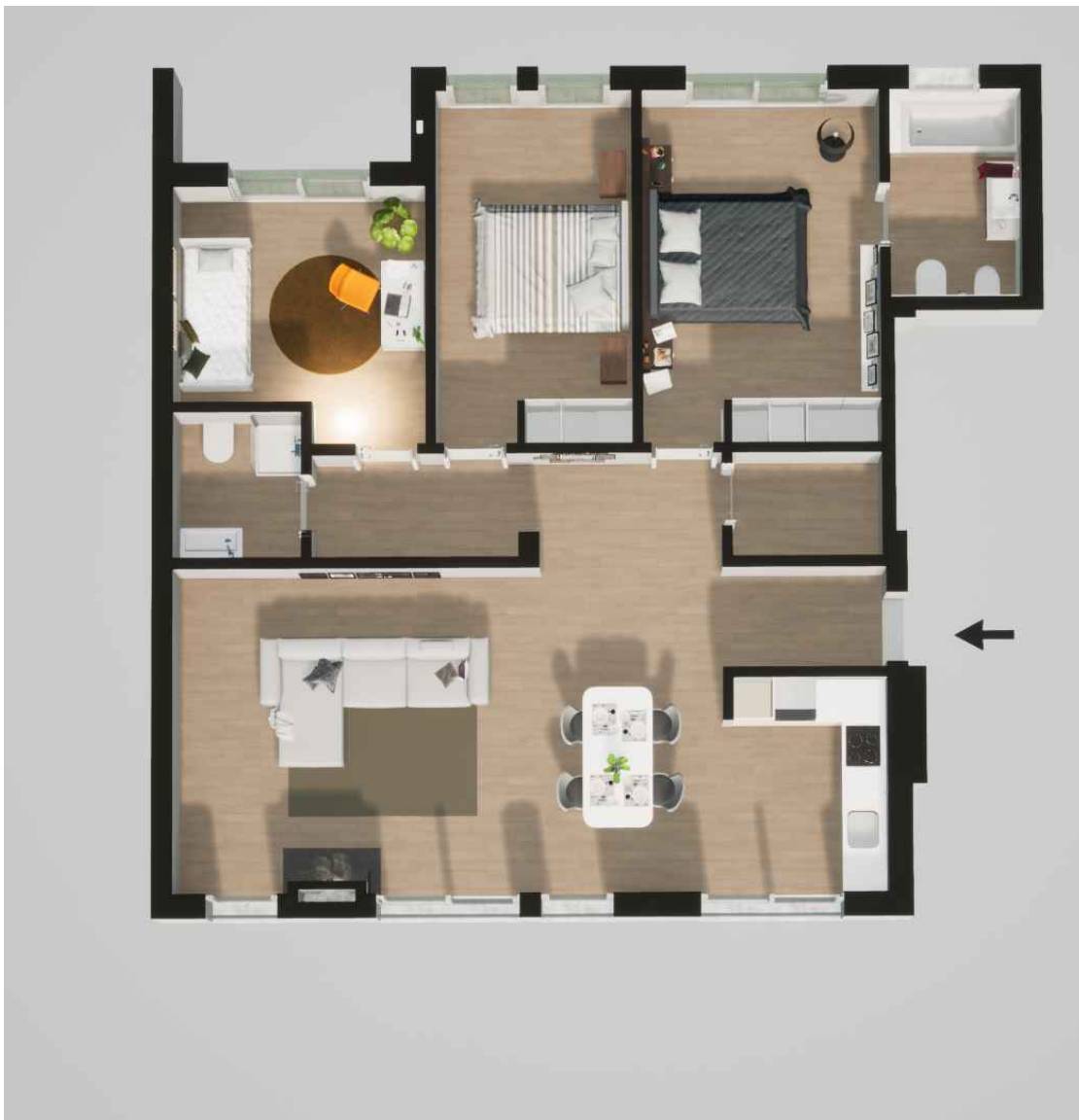
Fração A (141,15 m 2 ) Piso 0 - T3

Habitação (127,65 m 2 ) Garagem (13,50 m 2 )