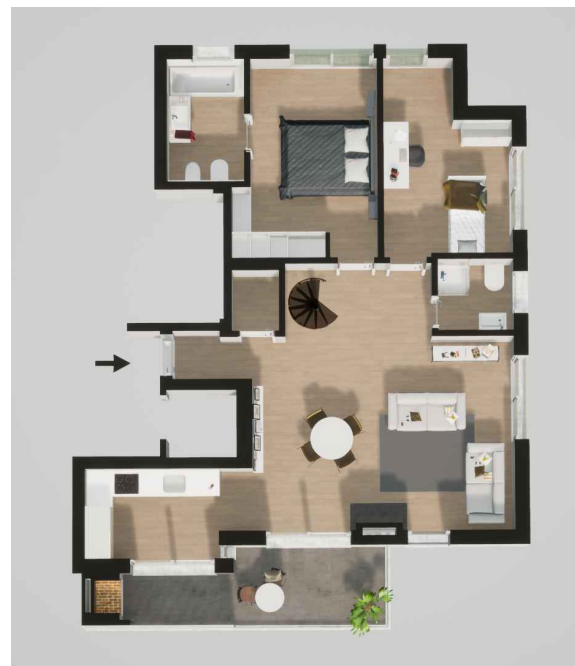
Fração E (245,25 m 2 ) Piso 2 - T4 + T0

Habituação (194,15 m 2 ) Varanda (14,70 m 2 ) - Terraço (23,20 m 2 ) - Garagem (13,20 m 2 )