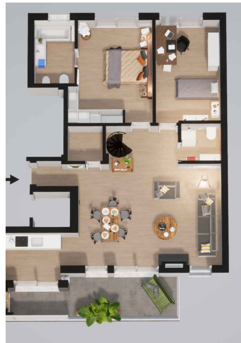
Fração E (274,65 m 2 ) Piso 2 e 3 - T4 + T0

Habituação (204,35 m 2 ) Varanda (14,70 m 2 ) - Terraço (33,10 m 2 ) - Garagem (22,50 m 2 )