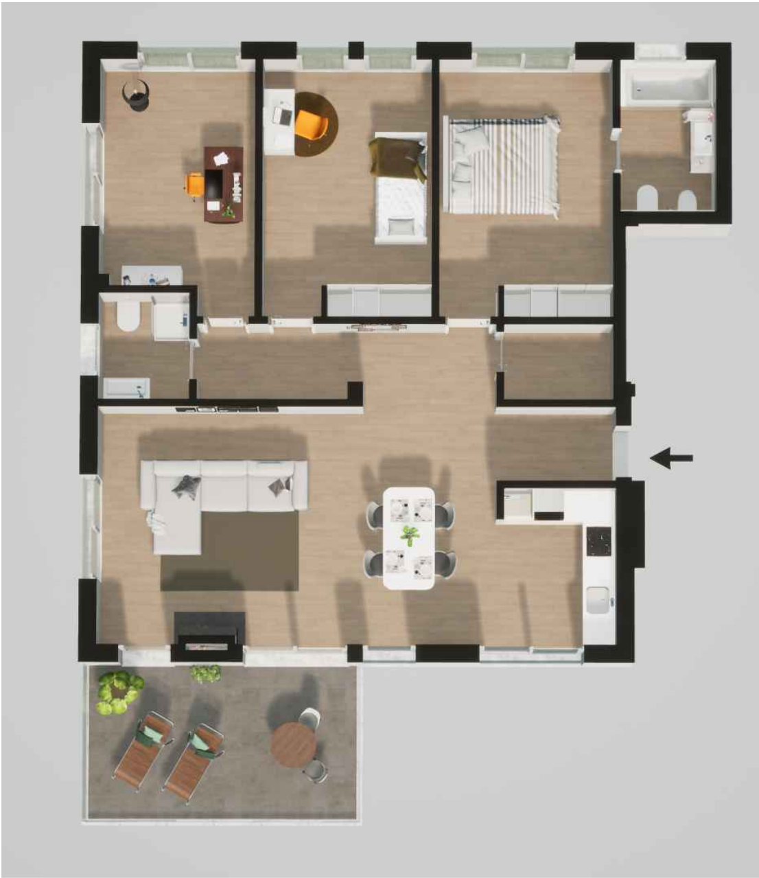
Fração A (164,10 m 2 ) Piso 0 - T3

Habitação (132,45 m 2 ) Varanda (16,90 m 2 ) - Garagem (14,75 m 2 )